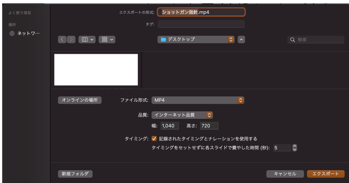
図 3. mp4 ファイルのエクスポート

収録が終わったら、「ファイル」メニューからエクスポートを選択してください。ファイル形式として mp4 ファイルを選択し、品質はインターネット品質を選択すると良いです。これで作成されたファイルを、大会 HP から提出してください。